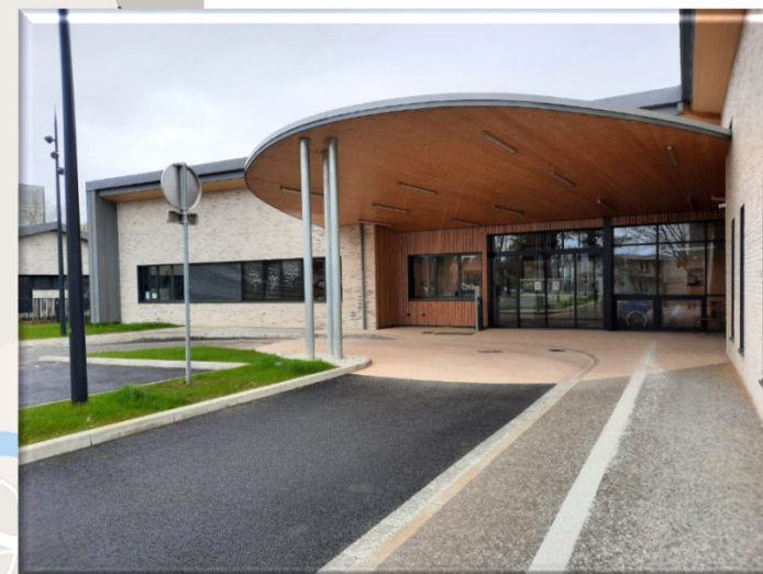
LA MAS MONTBELIARD